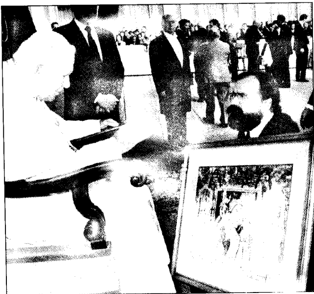
Abba Páter című képét a Vatikánban adja át II. János Pál pápának

– Nagyon hálás vagyok Kanádnak, hogy befogadott engem, családomat és minden magyar bevándorlót! Ezért is ajándékoztam az országnak az erre az alkalomra készített Canada Past, Present and Future című nagyméretű alkotásomat, amelyet maga a miniszterelnök, Jean Chrétien úr vett át tőlem 2001 márciusában, Ottawában, a parlamenti dolgozószobájában. Ebben a hatalmas országban, ahol sok-sok nép él együtt, nagy béke van! Nézzünk csak körül a világban, mindenhol háború, erőszak dúl. Ezért is szeretek itt élni.